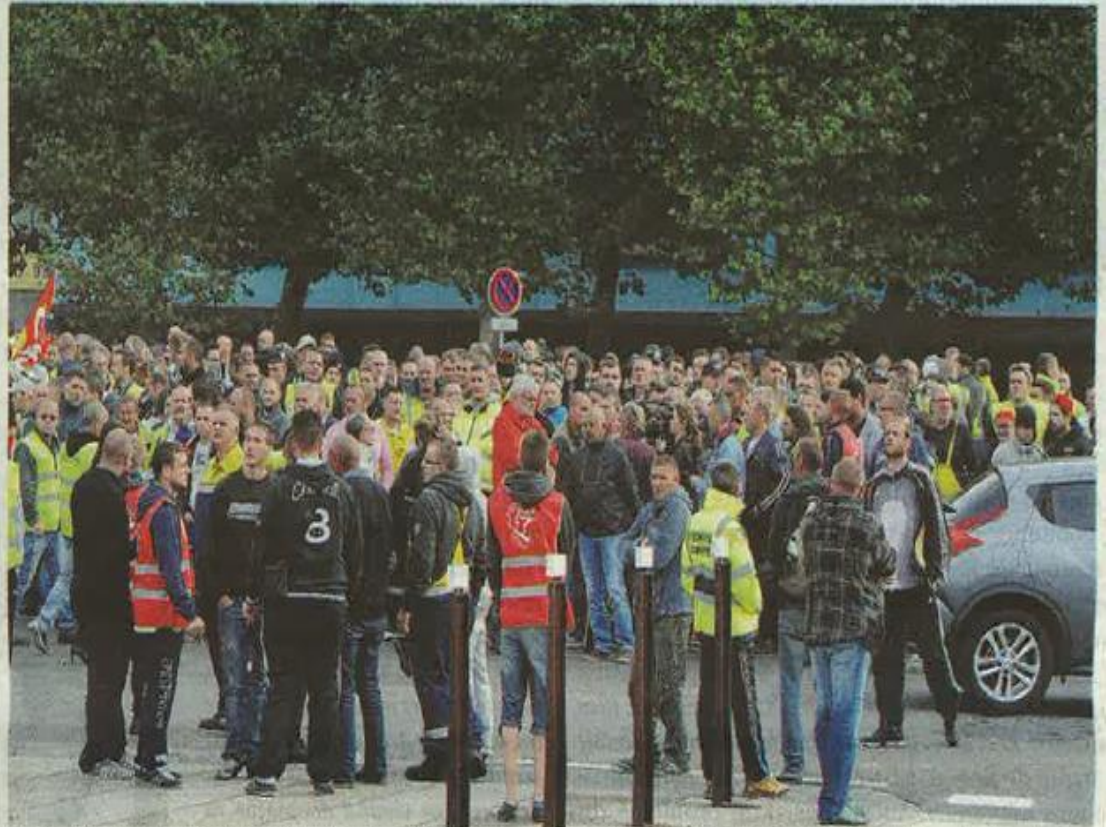
En soutien aux militants CGT, plus de 500 dockers ont cessé le travail pour les rejoindre