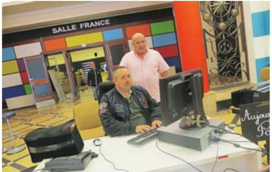
Les responsables du syndicat ont planté leur matériel à la gare

La gare maritime a abrité durant des années les actions sociales et syndicales du port. Les lieux ont été occupés à partir de 2012 par le Volcan maritime, la scène nationale du Havre était dans l'obligation de trouver un lieu de repli alors qu'un vaste programme de rénovation était engagé au théâtre du centre-ville. D'un commun accord et par convention entre le syndicat et la direction du GPMH, (Grand port maritime du Havre), des contreparties provisoires avaient été trouvées. Entre-temps, Areva a annoncé son intention de s'installer quai Joannès-Couvert. Cette annonce a clairement induit la destruction, confirmée par le GPMH, de la gare maritime. « L'installation du Volcan était temporaire. Il vient de terminer son déménagement. Nous devons réintégrer les lieux qui servaient à nos assemblées générales