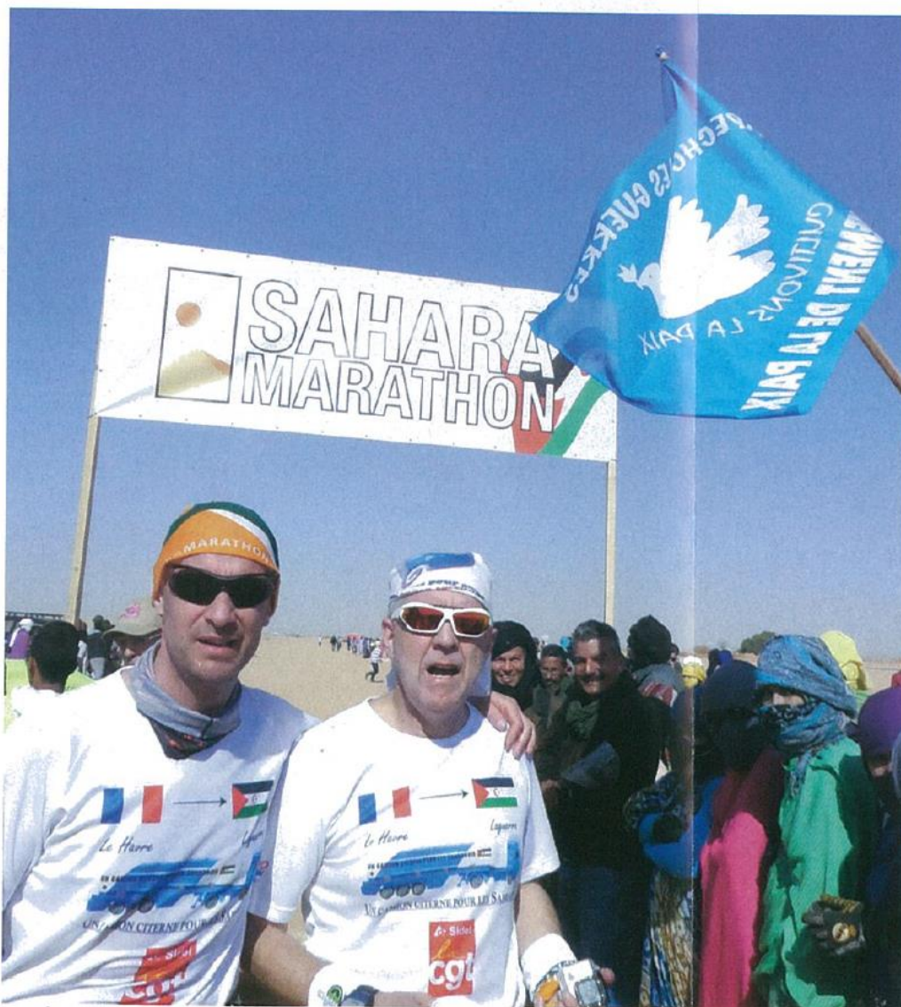
Les deux marathoniens du Havre.

Ce texte a été prononcé le 15 avril dernier, en introduction à la présentation de notre mission devant une belle assistance.