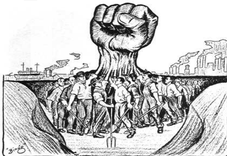
Solidarity, June 30, 1917. The Hand That Will Rule the World—One Big Union.